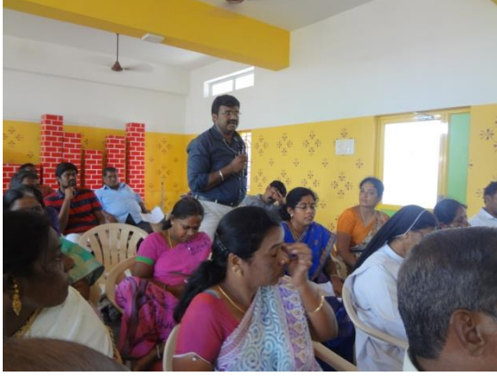
A participant raises a query to one of the speakers.