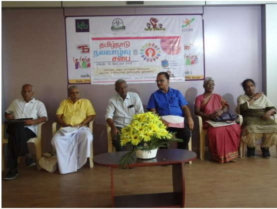
Some of the eminent participants seated on the dais.