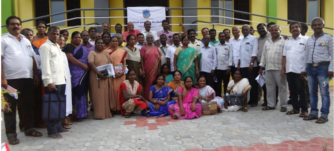
‘தமிழ்நாடு மக்கள் நலவாழ்வு சபையின்’ பங்கேற்பாளர்கள் அனைவருடனும் குழு-புகைப்பட அமர்வு