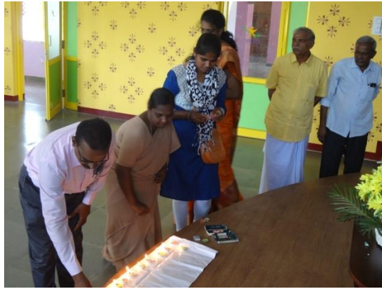
Lighting of the lamps at the start of the programme.